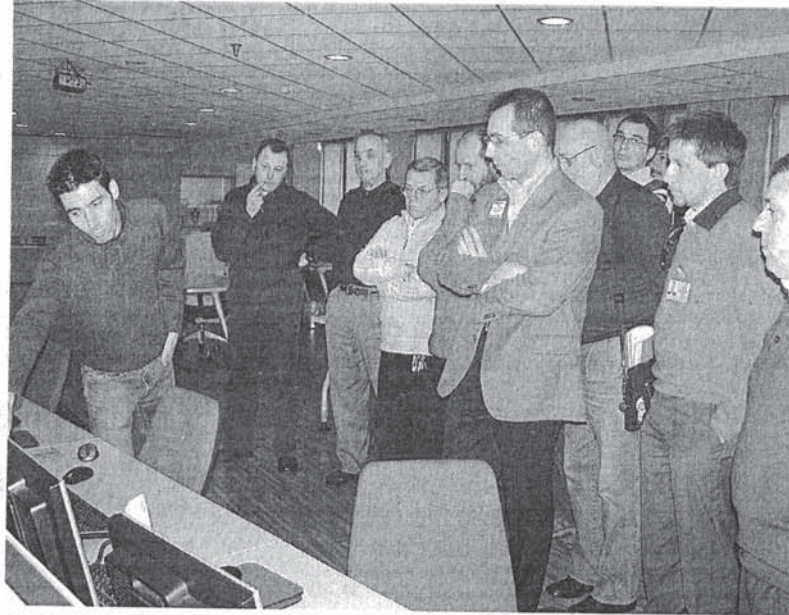
Il gruppo dei radioamatori magentini in visita alla sala di controllo della P.C.

"Inoltre - ha aggiunto Ferdani - un sofisticato sistema infotelematico di gestione dell'emergenza, con 24 postazioni di controllo, sempre in funzione, connesse anche via radio e via satellite alle sale operative di Enti locali e altre forze operative, con una protezione assoluta da blackout e da possibili cadute di linee, rende costante il monitoraggio delle situazioni di rischio e il collegamento con le